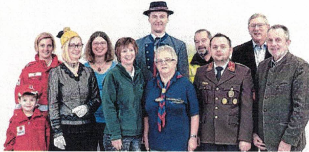
Sonderausstellung zum Thema Ehrenamt.

Im Museum muss man mucksmäuschenstill sein, Kunst ist sowieso ziemlich kompliziert und so ein Ausstellungsbesuch eine sehr steife und fade Angelegenheit. Ist das so? Natürlich nicht! Oberösterreichs Museen und Galerien sind lebendig, informativ, oftmals interaktiv – und bieten eine unglaubliche Vielfalt, von historischen Kunstschätzen und eindrucksvollen Originalfunden bis hin zu den neuesten Technologien.