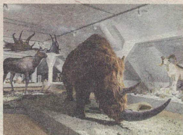
Die „Big Five“ der Eiszeit in Originalgröße.

KREINGLACH. Am 5. Februar wurde eine Sonderausstellung im Evolutionsmuseum Schmiding eröffnet. Mammut, Riesenhirsch, Wollhaarnashorn, Säbelzahn tiger und Höhlenbären in Originalgröße werden in lebensgethen Dioramen ausgestellt. Die Sonderausstellung hat noch bis 10. Juli, täglich von 9.00 bis 17.00 Uhr geöffnet.